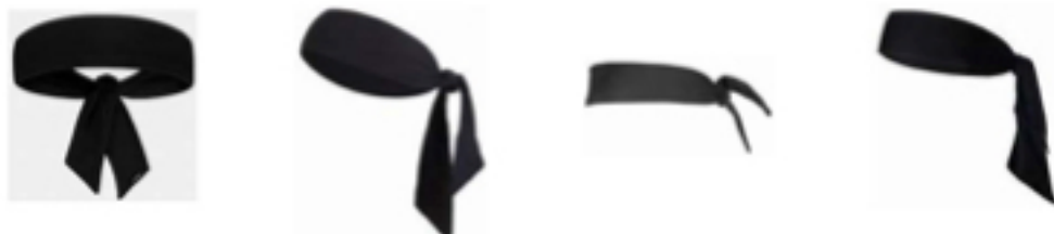
Рисунок 1. Пример головных повязок в виде косынки

4-4 Определение. Ношение головных повязок в виде косынки не разрешается.