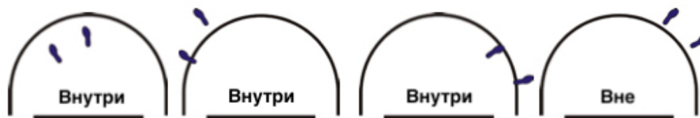
Рисунок 5. Положение игрока внутри/вне области полукруга без фолов столкновений

33-4 Пример: А1 выполняет бросок в прыжке, который начинается вне области полукруга. А1 сталкивается с В1, контактирующим с областью полукруга.