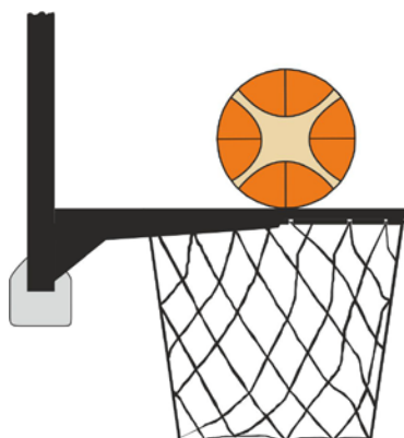
Рисунок 3. Мяч в контакте с кольцом

31-19 Определение. Нарушение помехи мячу во время броска с игры совершается защитником или нападающим, когда игрок касается корзины (кольца или сетки) или щита в тот момент, когда мяч находится в контакте с кольцом и все еще сохраняет шанс попасть в корзину.