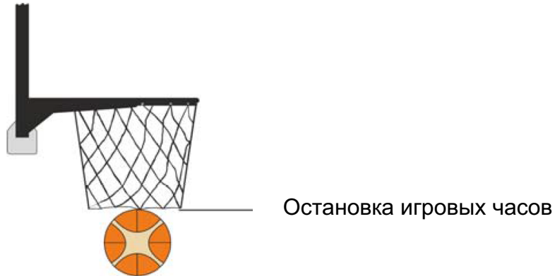
Рисунок 2. Попадание засчитывается